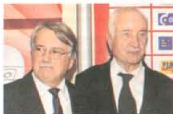
Heinrich Breloer hielt die Laudatio auf Armin Mueller-Stahl (r.)