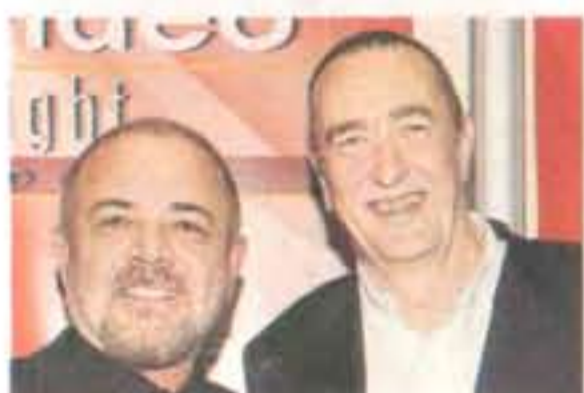
Laudator Uli Edel mit Kollege, Preisträger Bernd Eichinger (r.)