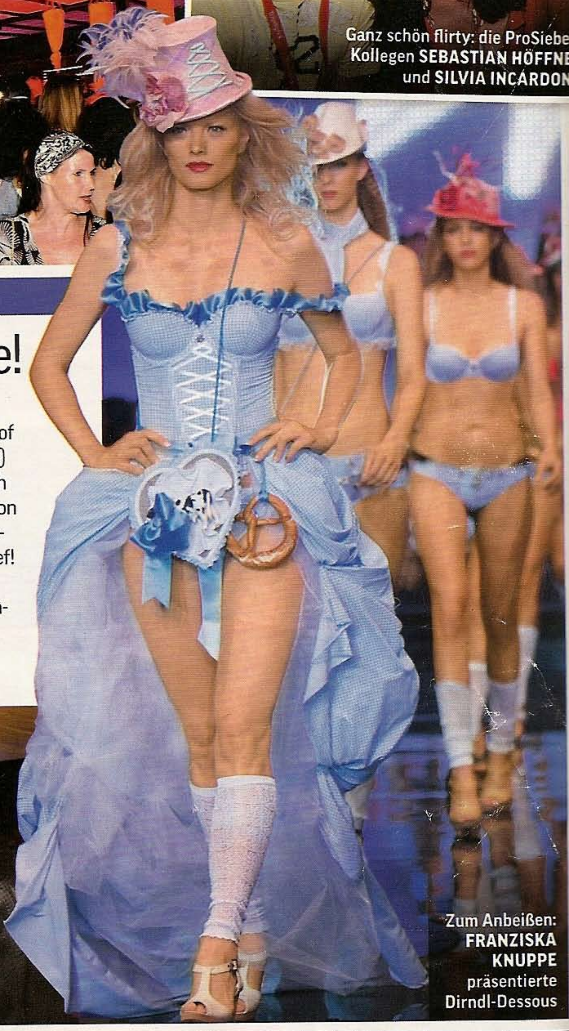
Zum Anbeißen: FRANZISKA KNUPPE präsentierte Dirndl-Dessous