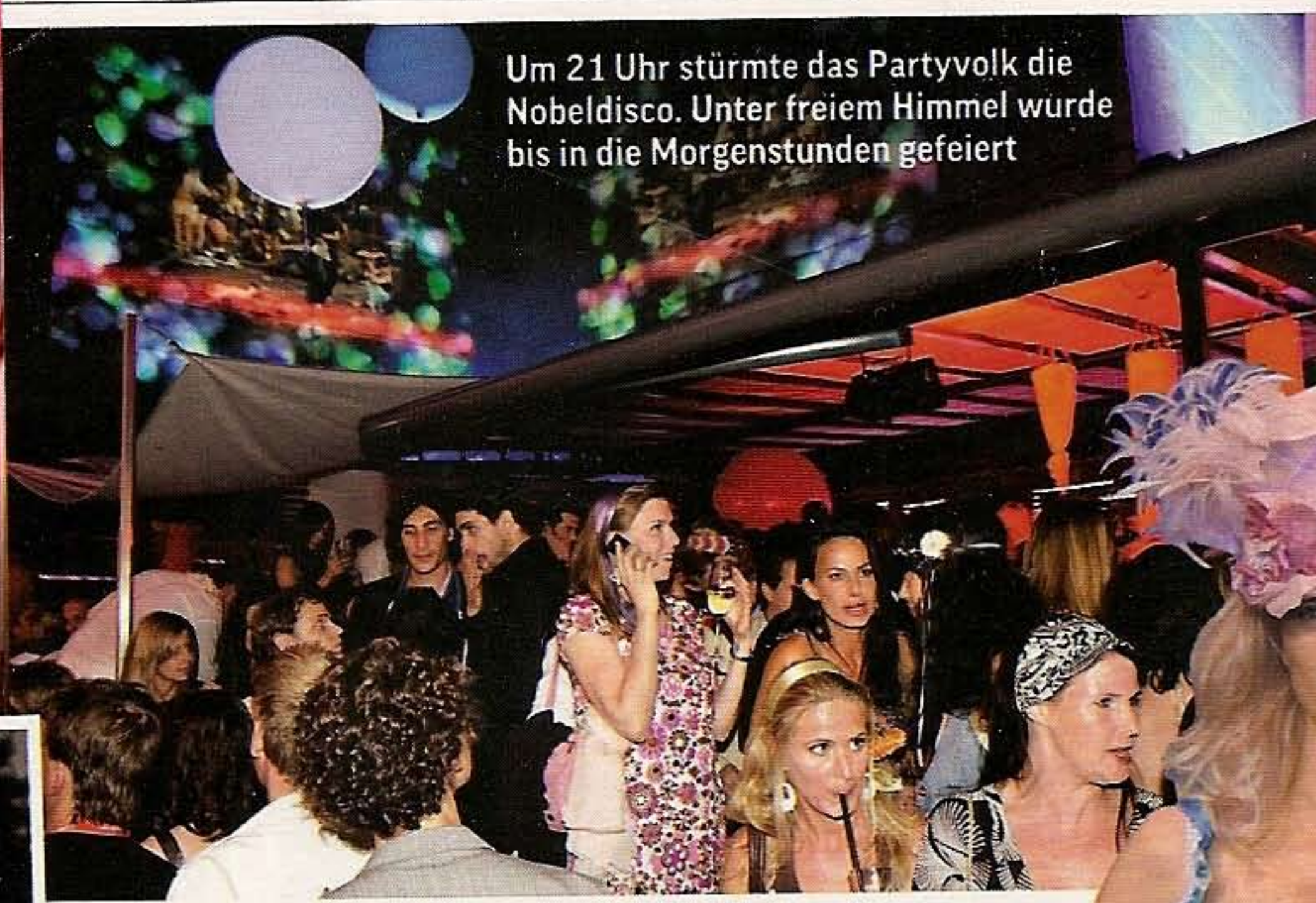
Um 21 Uhr stürmte das Partyvolk die Nobeldisco. Unter freiem Himmel wurde bis in die Morgenstunden gefeiert