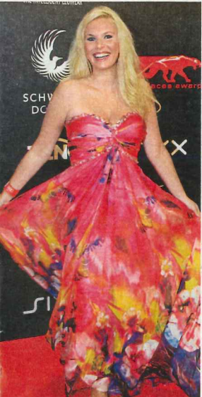
Duftig-bunt: Moderatorin Alessandra Geissel in einer Seidenrobe