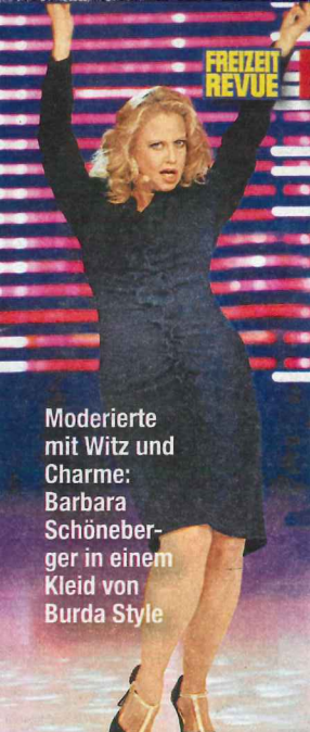
Moderierte mit Witz und Charme: Barbara Schöneberger in einem Kleid von Burda Style