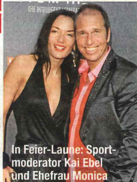
In Feier-Laune: Sportmoderator Kai Ebel und Ehefrau Monica